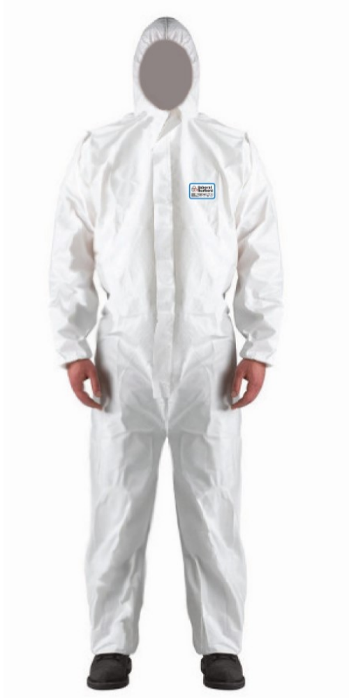
Tabla de medidas

Opciones - COSTURAS COSIDAS / COSTURAS SELLADAS