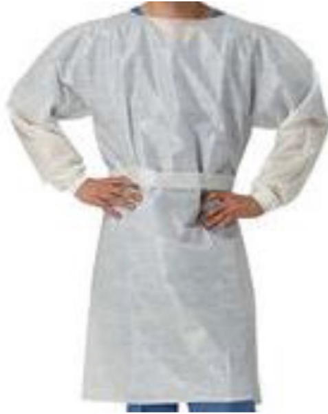
Tabla de medidas